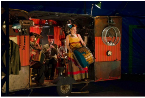
« Capharnaüm Caravan »