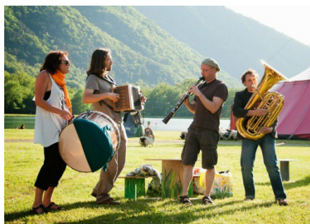
Cie La soupe aux étoiles