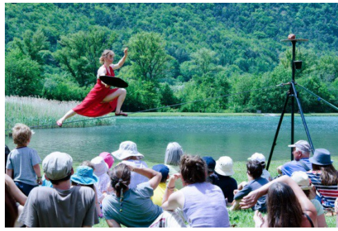
« Essence ciel » Cie Mauvais Coton