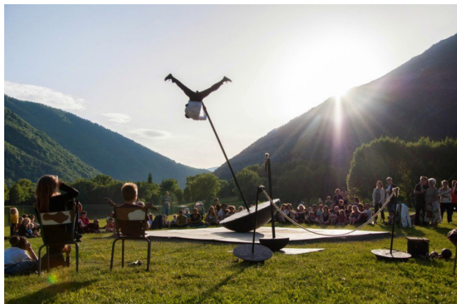
« Culbuto » Cie Mauvais Coton »