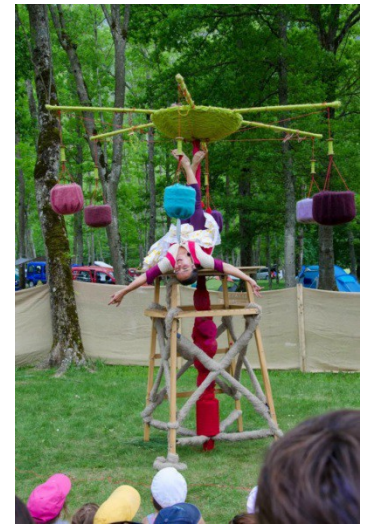
« Perds pas le fil » Cie Nanoua

Par ailleurs, trois compagnies ont été en résidence toute la semaine pour travailler sur leurs créations qui ont été présentées aux festivaliers pendant le weekend : La compagnie Pile ou versa, Alternez et la fabrique Alpine. Nous nous sommes attachés comme toujours à travers la programmation à réunir tous les publics, grands, petits, familles, amis autour de spectacles pluri-disciplinaires qui nous ont particulièrement surpris et touchés et que nous avons eu envie de partager.