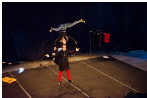
« All Right » Cie La main s'affaire